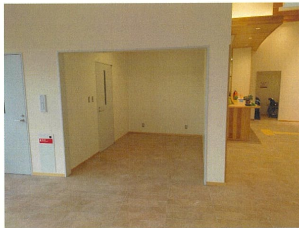
④飲食物販コーナー